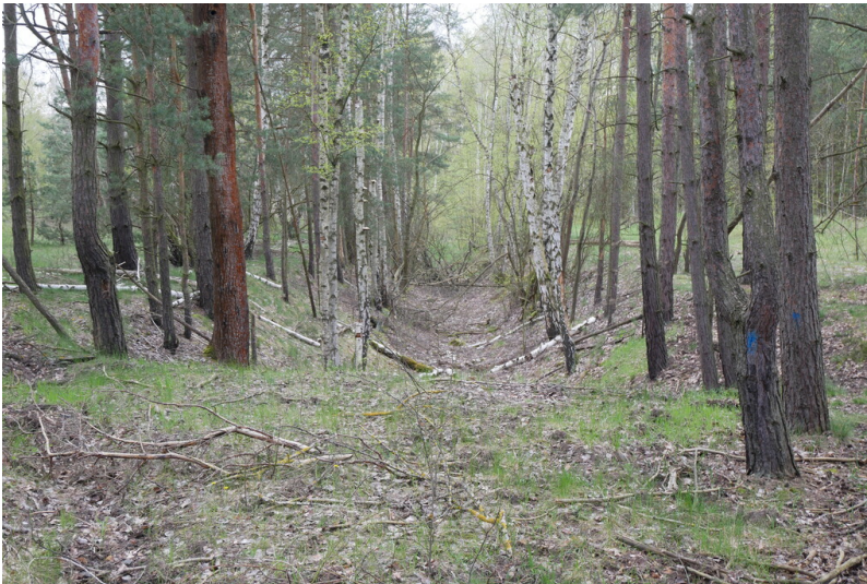
Grubenwasserreinigungsanlage Schmiegelmühle