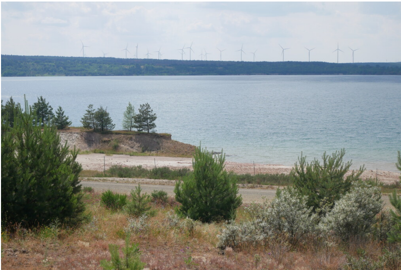
Altdöberner See