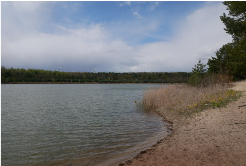
Caseler See