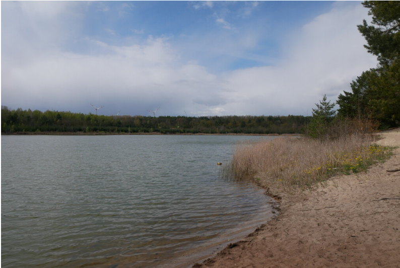
Caseler See