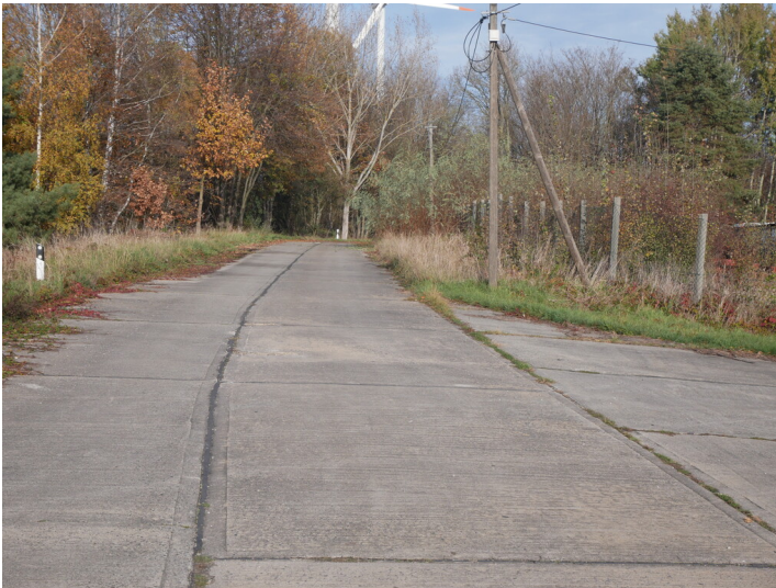
ehem. Zufahrtsstraße zu der Tagebauwerkstatt Römerkeller des Tagebaus Klettwitz (1947-1991)