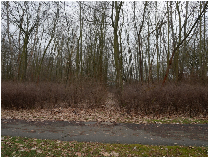
Schutzpflanzung Raddusch