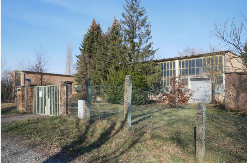
Einlaufbauwerk Boblitz