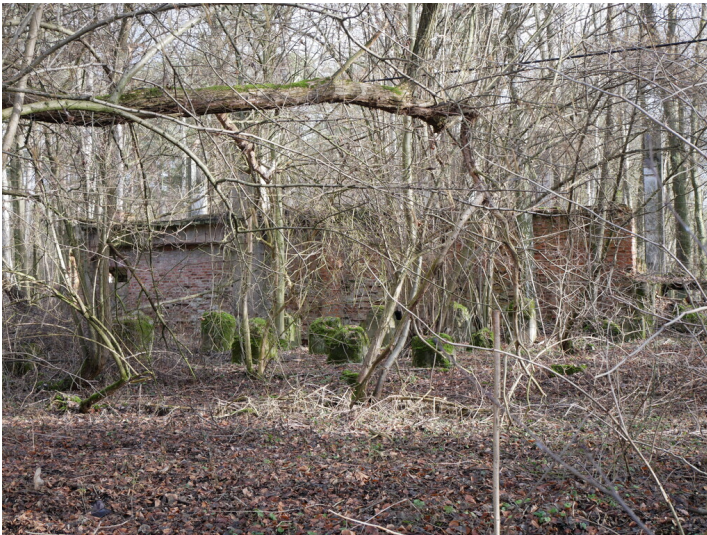
Trafostation Bornsdorfer BKW