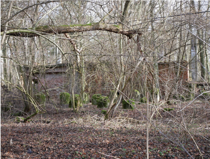
Trafostation Bornsdorfer BKW