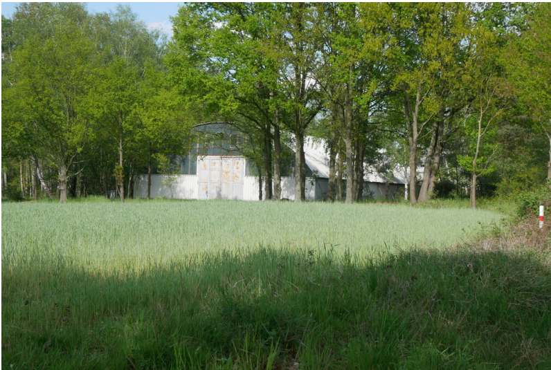
Tagesanlagen Pritzen