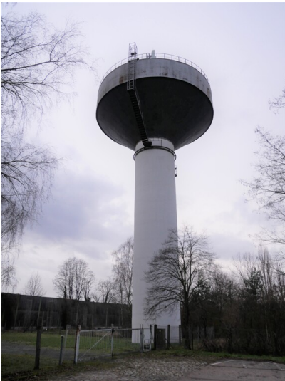
Wasserturm und Pumpstation Vetschau