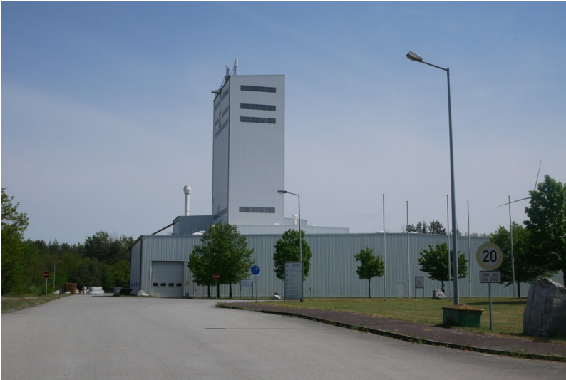
Gipswerk Vetschau