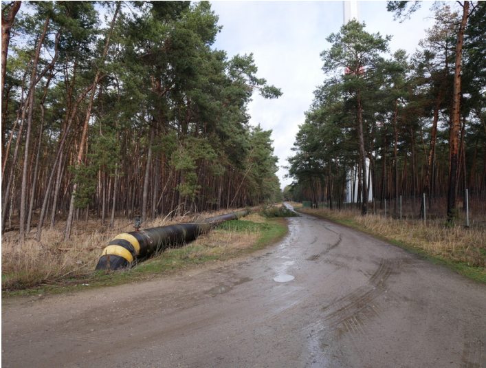
Wasserleitung zur Flutung des Gräbendorfer Sees