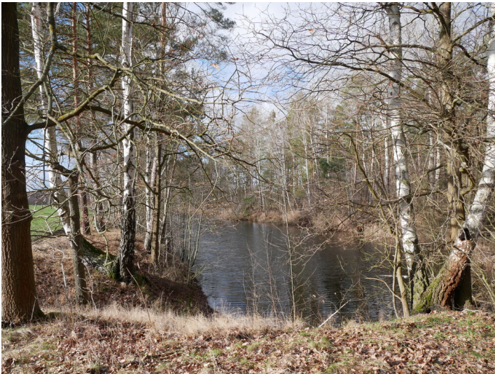
Nadel (Bornsdorfer Teiche)