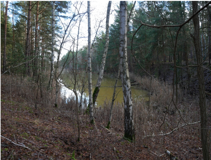
Neue Kohlegrube (Bornsdorfer Teiche)