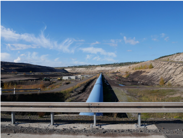
Bandanlage Vorschnitt