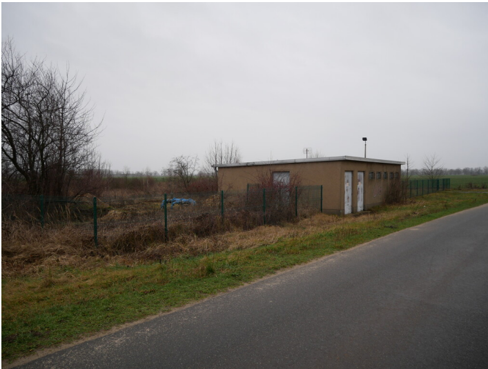
Pumpwerk (Zinnitzer Ableiter) und Trafo-Station