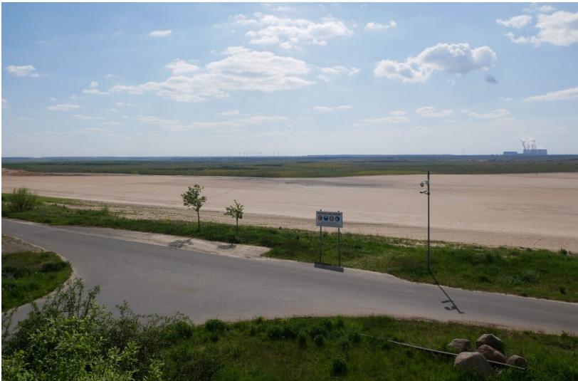
Aussichtspunkt Grieben-Süd