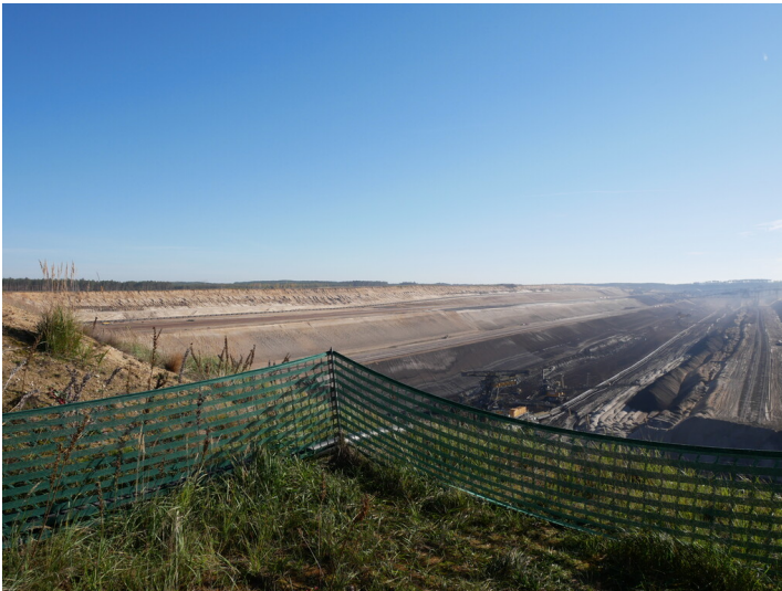
mobiler Aussichtspunkt