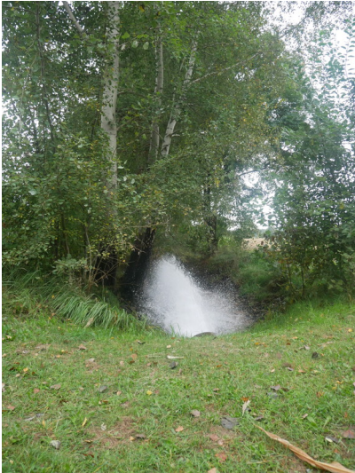
Steinitzer Wasser

Schlagwörter: Wassergraben Fachsicht(en): Denkmalpflege Gemeinde(n): Drebkau Kreis(e): Spree-Neiße Bundesland: Brandenburg