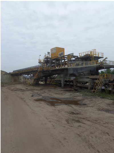
Antriebsstationen Kohleband