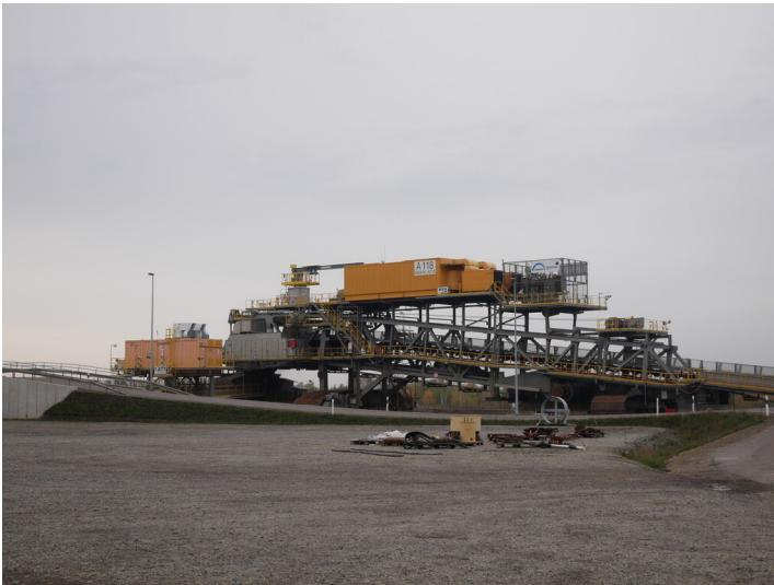
Bandantriebsstationen Neue Kohleverladung