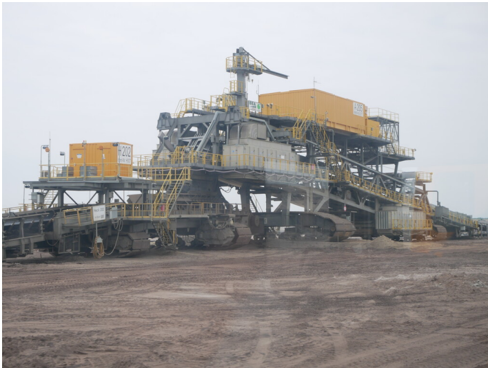
Antriebsstationen Bandanlage Vorschnitt 2