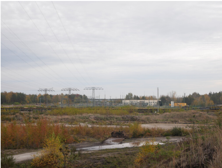
Umspannwerk Wolkenberg