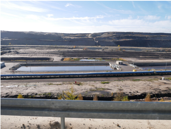
Absetzbecken Tagebau Jänschwalde