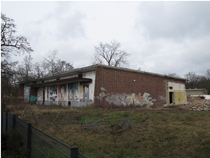
Restaurant Turbine