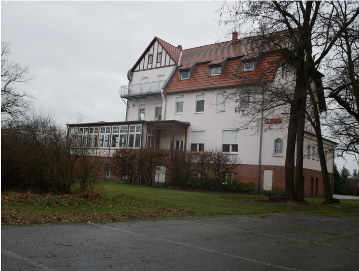
Tagesanlagen des Tagebaus Schlabendorf-Süd TA Zinnitz