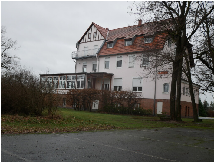
Tagesanlagen des Tagebaus Schlabendorf-Süd TA Zinnitz