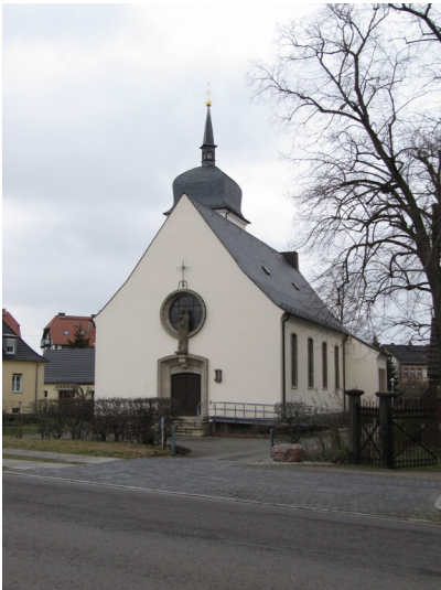
Kirche St. Maria Verkündigung