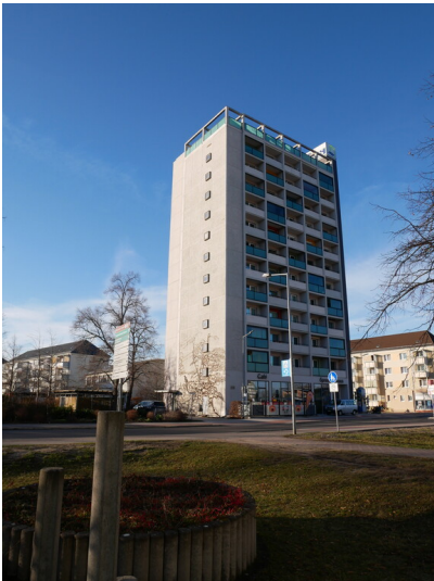
Hochhaus am Roten Platz