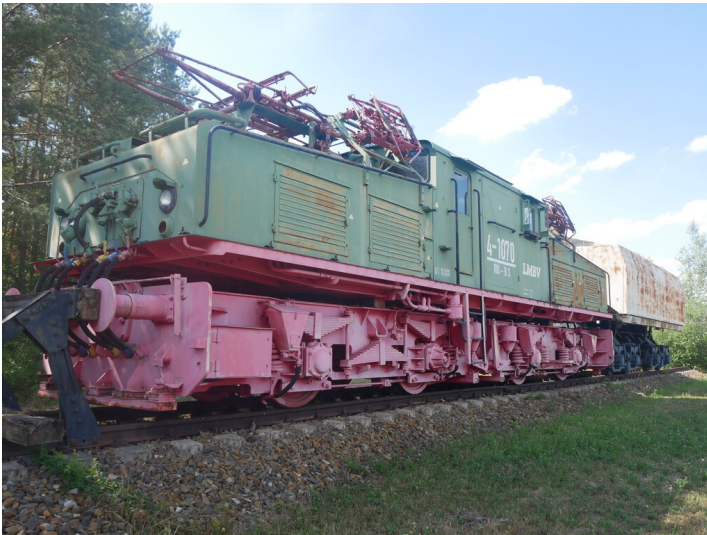
dl-by-de/2.00 t-E-Lok und 40 m 3 -Abraumwagen