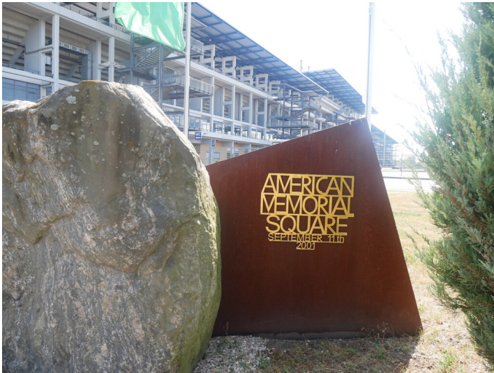
American Memorial Square