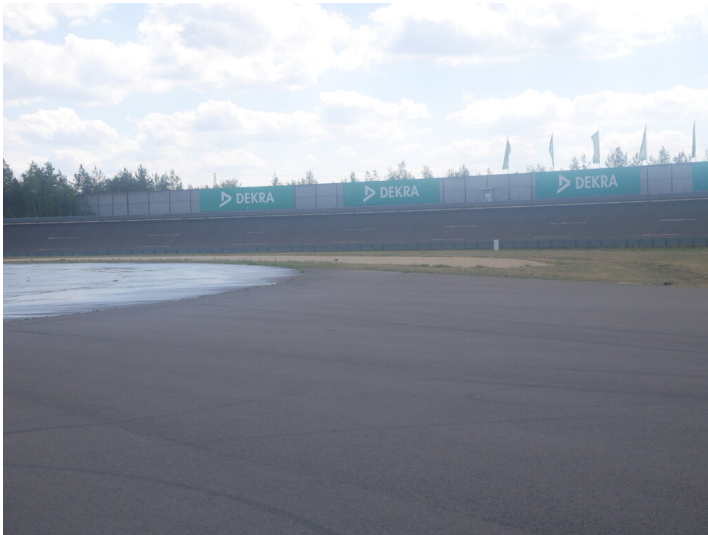
DEKRA Test-Oval