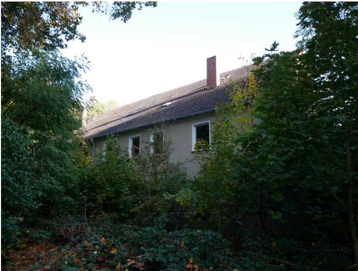
Siedlung Friedrichsthal