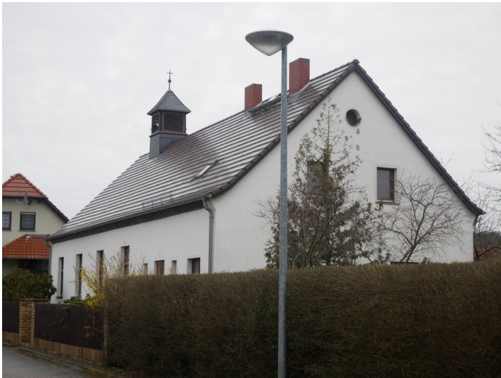
Evangelische Kirche Schipkau