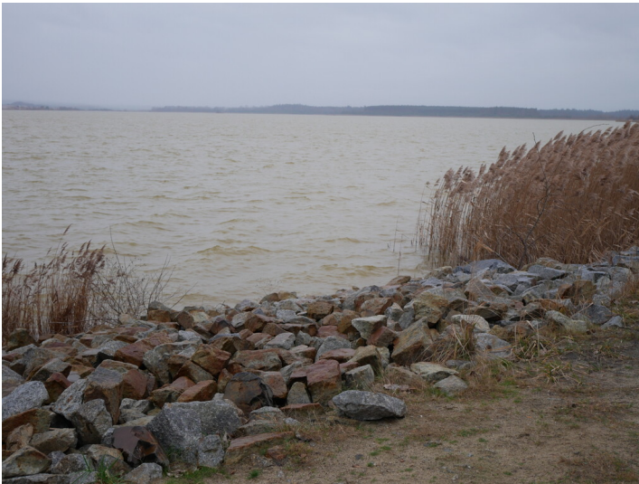
Marina Schlabendorf