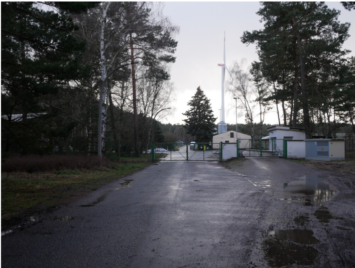
Broilermastanlage Vetschau