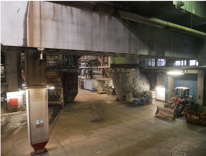
Dampferzeuger Kraftwerk Jänschwalde (2022)