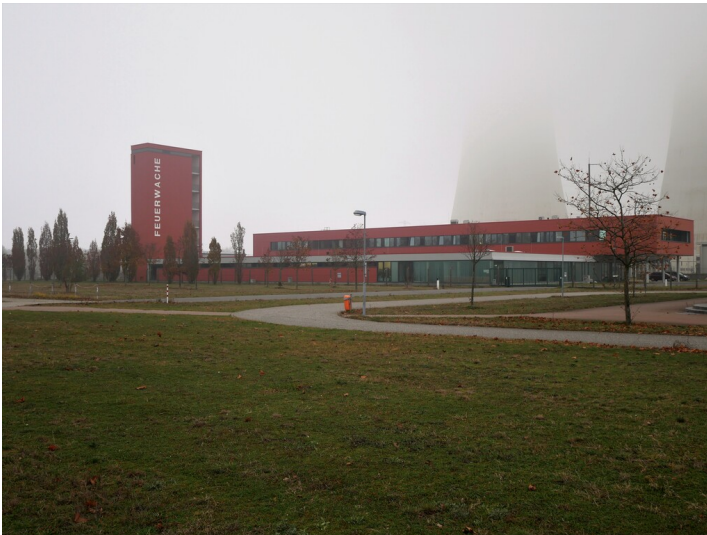
Neue Feuerwehr Kraftwerk Jänschwalde