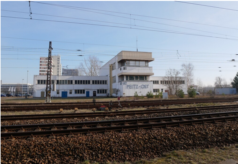
Stellwerk Kraftwerk Jänschwalde