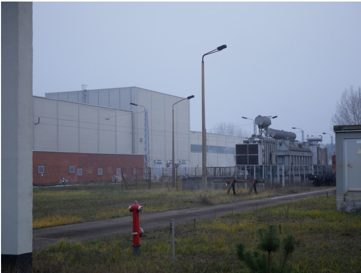
Heizölversorgung Kraftwerk Jänschwalde (2022)