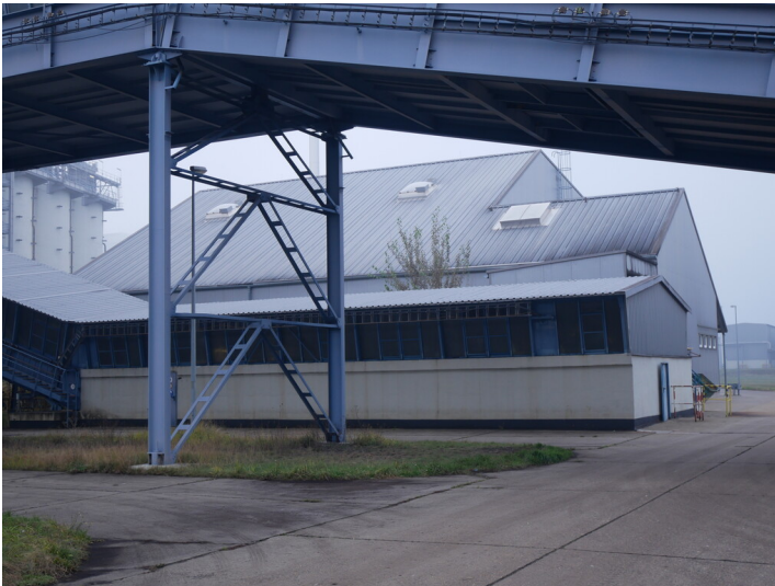
Ersatzbrennstoffanlage Kraftwerk Jänschwalde (2022)