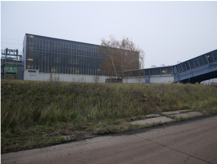
Übergabestation Kraftwerk Jänschwalde (2022)