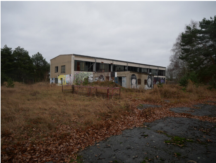
Umspannwerk Tagebau Schlabendorf-Seese