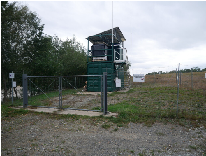
Grubenwasserreinigungsanlage Raddusch