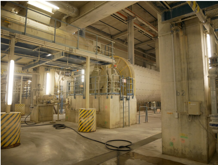
Kraftwerk Jänschwalde Kalkaufbereitung (2023)