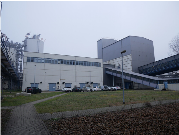
Kraftwerk Jänschwalde Brechergebäude (2022)