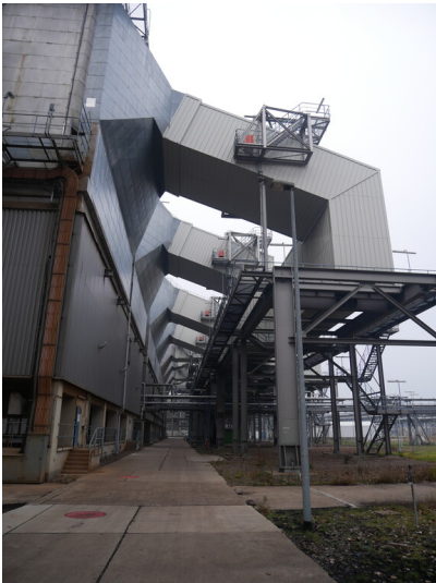
Kraftwerk Jänschwalde E-Filter (2022)