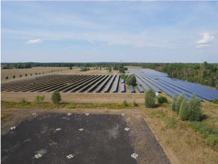
Photovoltaikanlage Lauchhammer