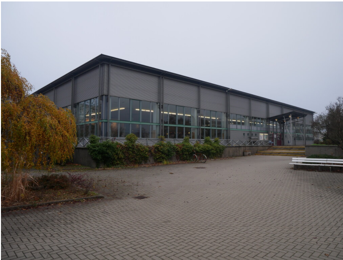
Kraftwerk Jänschwalde Kantine (2022)