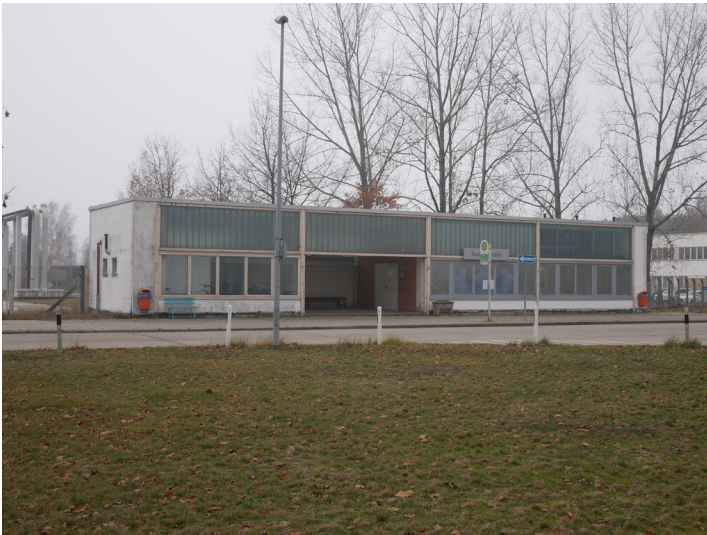
Buswartehalle Kraftwerk Jänschwalde