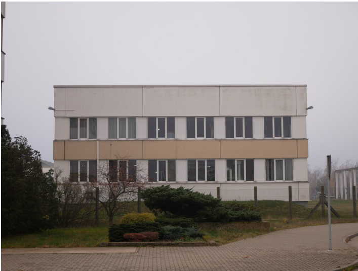
Fernmeldegebäude Kraftwerk Jänschwalde