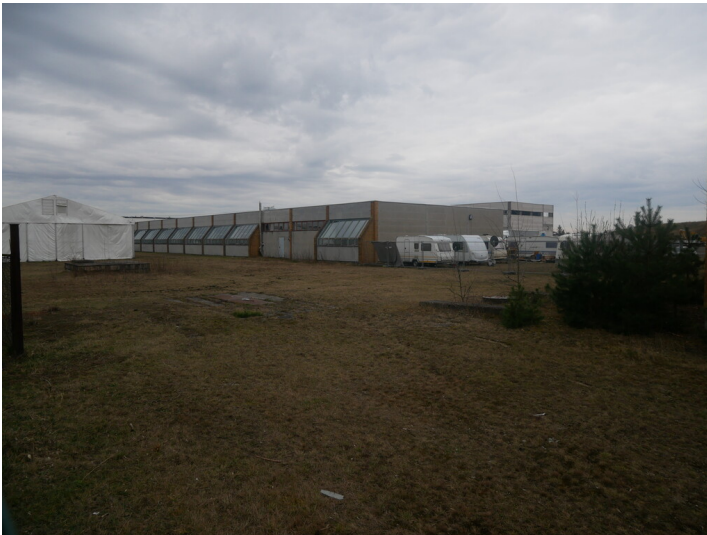
VEB Niederlausitzer Klinkerwerke Großräschen